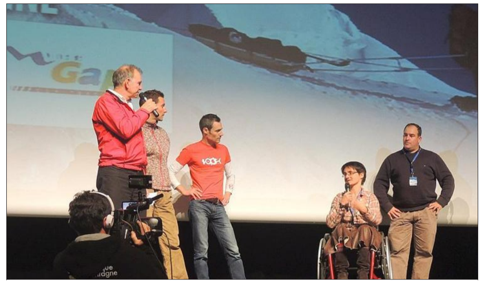
"Nat & co" a permis de faire découvrir le ski de rando tracté, activité solidaire et pour le moins très amicale.

Hier soir, ces 5 e rencontres se sont terminées sur le pilier sud des Drus découvert en escalade et en base jump. Et au Népal, mais pas celui des hauts sommets codifiés, dans celui de l'Himalayiste alternatif. Non sans être allés